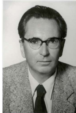
Porträt Viktor Frankl. Photographie. Um 1950.